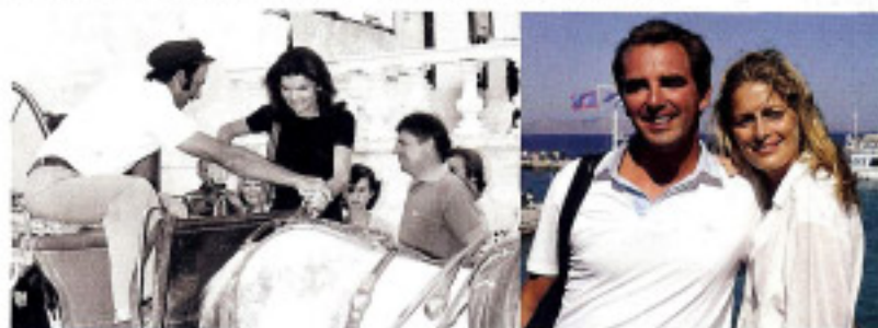
La famiglia Niarchos, Jackie a Spetses. Nikolaos di Grecia e la moglie Tatiana Blatnik. Melina Mercouri.