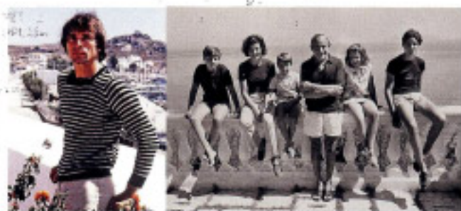
Nella pagina accanto. Angoli dell'isola, dell'Orloff Resort e del suo ristorante. In questa pagina. Nureyev.